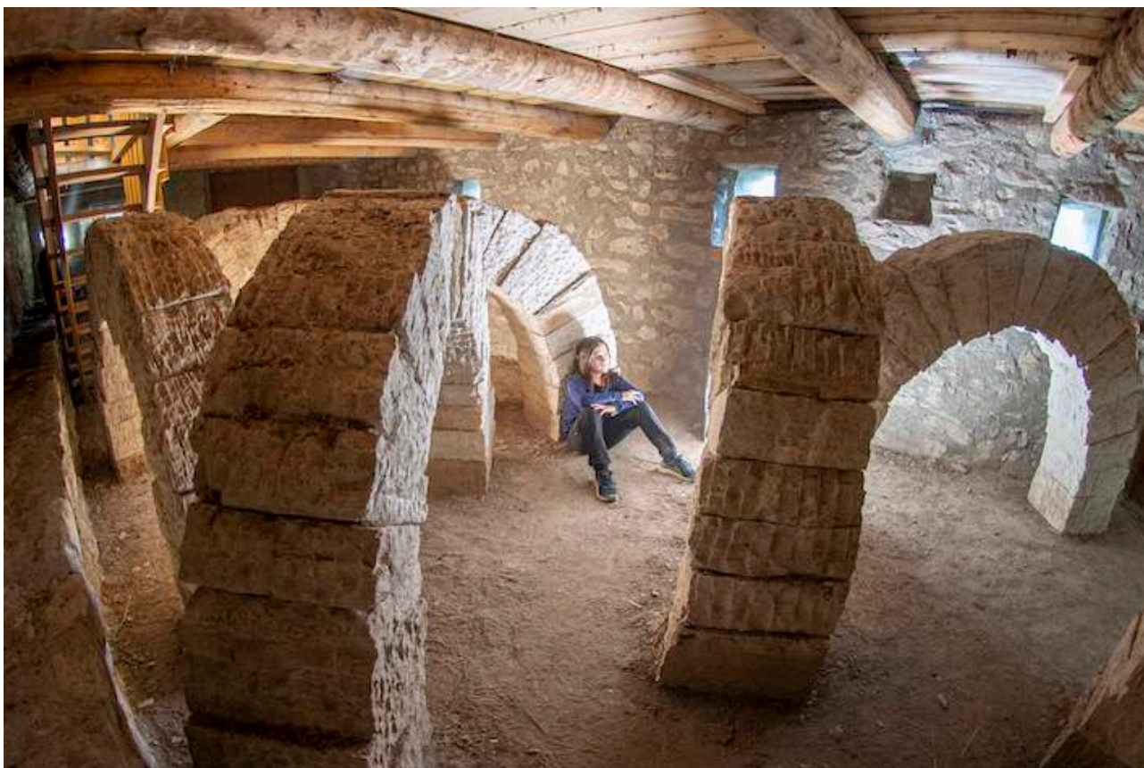
Dans le refuge d'art de La Ferme Bellon