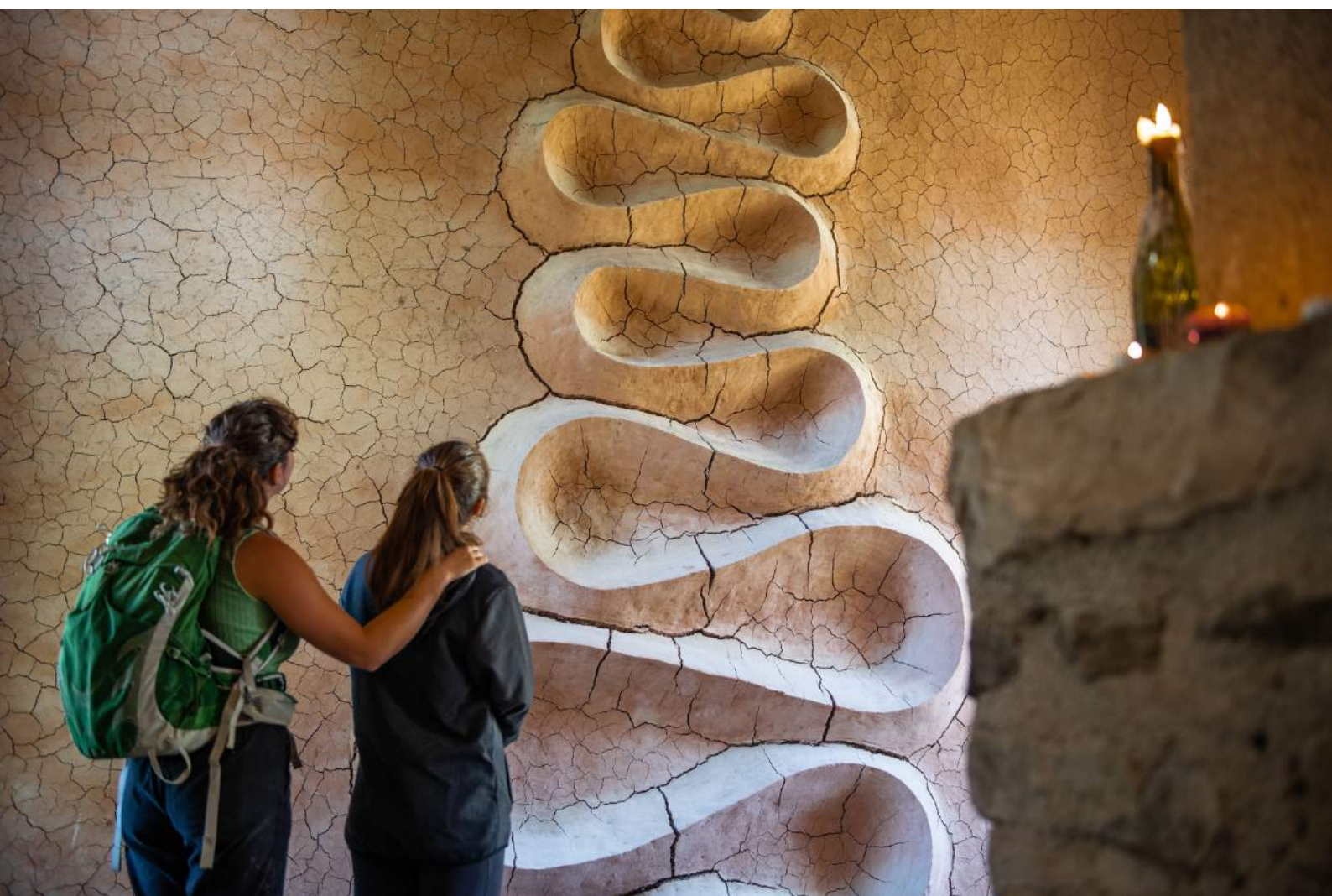
Andy Goldsworthy, refuge d'art du Vieil Esclangon

4 dates en 2024 : 26-31 mai / 25-30 juin / 30 septembre-5 octobre / 12-17 octobre