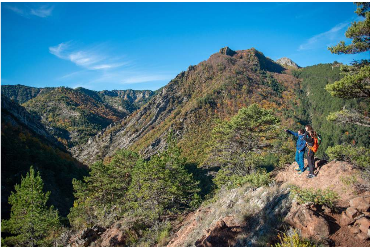
Sur le sentier qui monte vers le Vieil Esclangon

* Nous pouvons être amenés à modifier l'itinéraire indiqué : soit au niveau de l'organisation (problème de surcharge des hébergements, modification de l'état du terrain, éboulements, sentiers dégradés, etc.), soit directement du fait du guide (météo, niveau du groupe, etc.). Ces modifications sont toujours faites dans votre intérêt, pour votre sécurité et pour un meilleur confort.