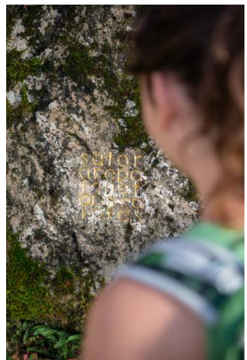
En haut : dans le refuge d'art du col de l'Escuichière. En bas à gauche : déjeuner dans le refuge d'art du Vieil Esclangon. En bas à droite : le palindrome de herman de vries.