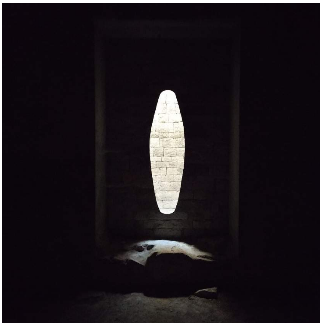
ANDY GOLDSWORTHY, REFUGE D'ART DE LA FOREST