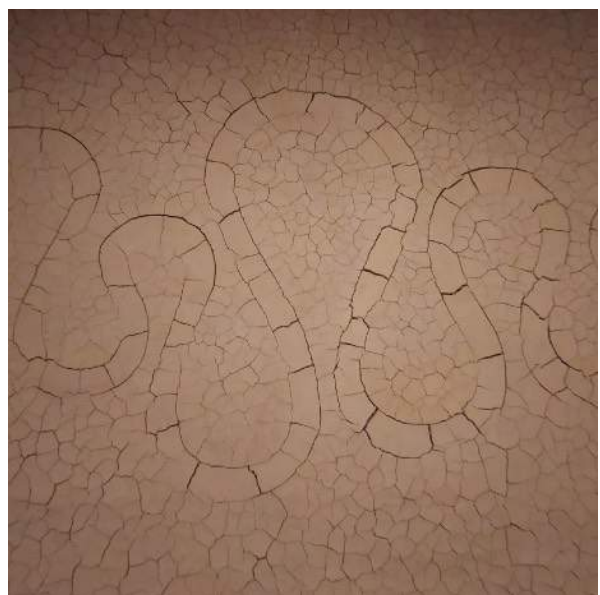
En haut à gauche : la sentinelle du Vançon. Au milieu à gauche : refuge d'art du col de l'Escuichères. Au milieu à droite : la dalle aux ammonites, vestige d'un fond marin il y a deux cent millions d'années. En bas à gauche : le Vélodrome d'Esclangon. Ici, il, y a vingt millions d'années, se tenait une lagune tropicale. En bas à droite : River of Earth, d'Andy Goldsworthy.