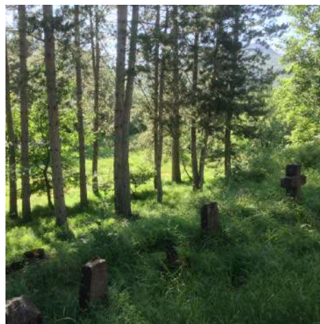
En haut : dans le refuge d'art du col de l'Esquièr. Au milieu : l'oeuvre d'Andy Goldsworthy dans le refuge d'art du Vieil Esclangon. Ci-dessus, le refuge d'art de La Forest et ses abords immédiats.